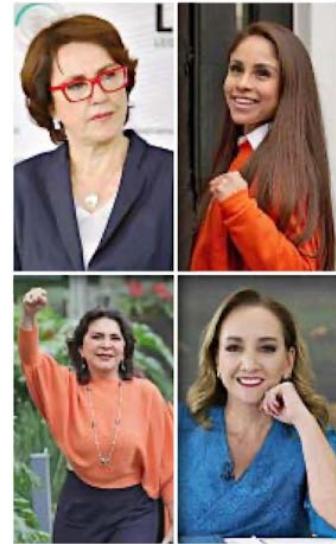
■ Patricia Mercado, Paola Longoria, Ivonne Ortega y Claudia Ruiz Massieu van por MC.

De Guanajuato, van por la reelección Ector Ramírez Barba y Ricardo Villarreal.