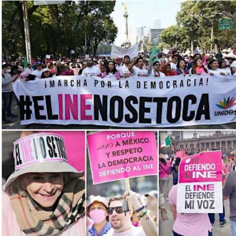
■ Las movilizaciones en favor de la autonomía del INE han sido la columna vertebral de la “Marea Rosa”

Muestra del miedo, agrega, es su inconformidad de