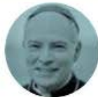
CARLOS AGUIAR RETES

► El único candidato que hizo presencia ayer en el ensayo para el tercer debate presidencial fue el emecista Jorge Álvarez Máynez , pues la morenista Claudia Sheinbaum y la abanderada del PAN, PRI y PRD, Xóchitl Gálvez , enviaron representantes. Sin embargo, nos dicen que ambas ya traen muy afinadas sus estrategias para el último encuentro.